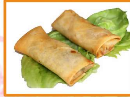
N3. Rollitos Thai