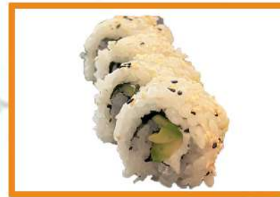
N97. Vegetal roll (pepino, aguacate, philadelphia) 4PZ (Gold)