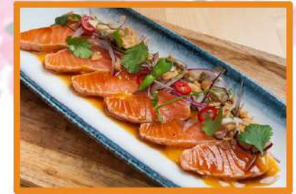
N73. Tataki salmón - 6pz