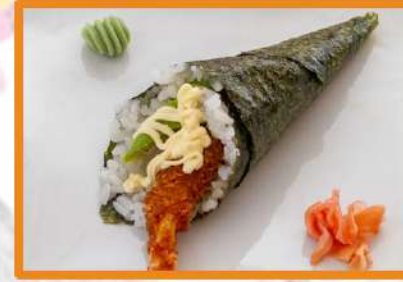
N93. Temaki langostino frito (con aguacate y mayonesa picante)