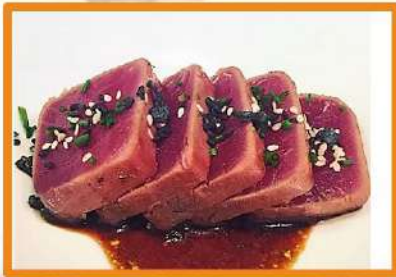
N74. Tataki atún rojo - 6 pz