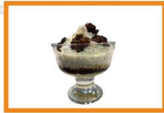
Flan con nata y nueces caramelizadas 4.50 €