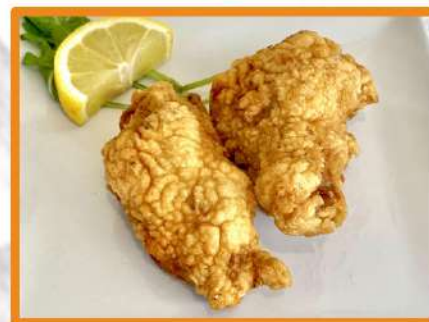
N41. Alicas de pollo fritas - 2 piezas