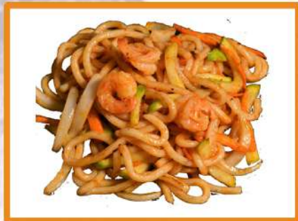
N22. Udon de gambas

(huevo, jamón york, zanahoria, guisantes)