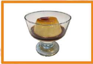
Flan de vainilla con caramelo - 2.75 €