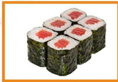
N61. Maki atún rojo - 4 pz