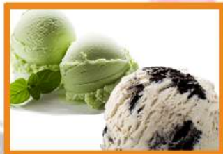
Helado de Oreo o Matcha (té verde) 1 bola 3.75 €