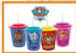
Vasito Patrulla canina