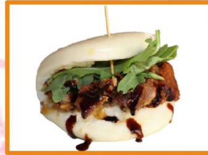
N17. Pato bao

(langostino frito, rúcula y salsa mayonesa especial)