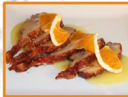
N48. Pato asado con naranja fresca + 1€ (1ºGratis)