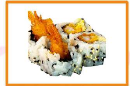
N103. California Langostino (con aguacate y mayonesa) 4PZ