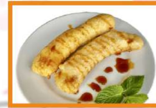
Platano frito con miel 3.75 € (flambeado + 1€)