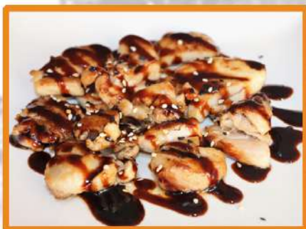
N39. Pollo Teriyaki (pollo muslo a la plancha con salsa Teriyaki y sésamo)