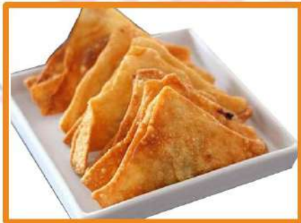
N7. Wantun frito