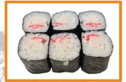
N67. Maki surimi 4pz