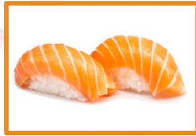
N80. Nigiri salmón 2pz