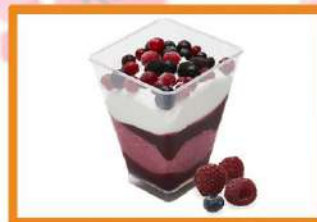
Sensación frutos rojos

Helado de queso fresco y sorbete de frambuesa