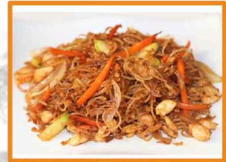
N25. Fideos finos