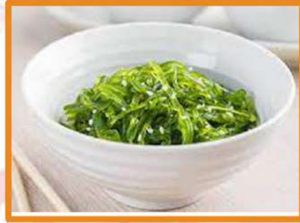
N2. Ensalada wakame

(lechuga, zanahoria, jamón York algas y brotes soja)