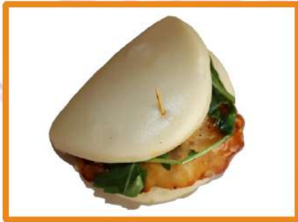
N14. Tori bao

(pollo frito japonés, rúcula y salsa teriyaki)