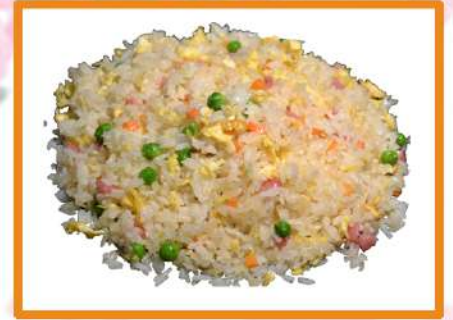
N21. Arroz 3 delicias

(pato asado de la casa, rúcula y salsa especial)