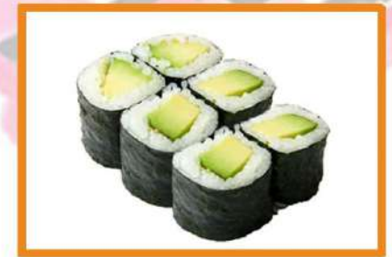
N63. Maki aguacate (con sésamo) - 4pz