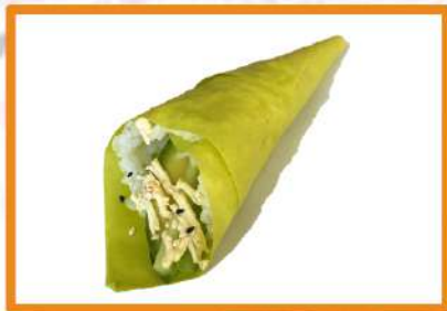
N95. Temaki vegetal

(nori de soja, aguacate, pepino, mayonesa japones y sésamo) (GOLD)