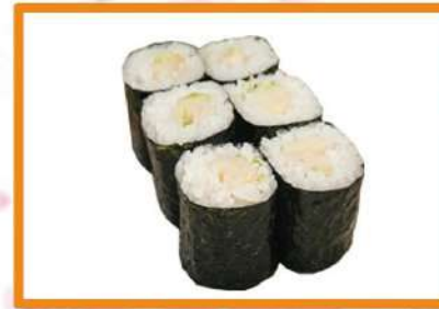
N62. Maki pez mantequilla - 4pz