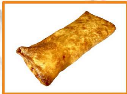
N5. Rollo primavera

(lechuga, tomate cherry, salmon, mango, aguacate, sésamo)