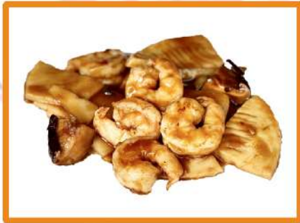
N43. Gambas con bambú y setas