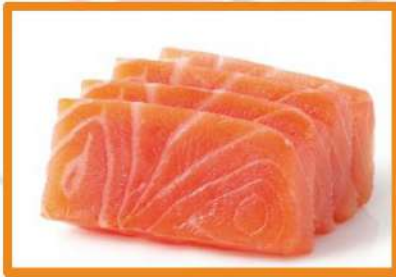
N70. Sashimi salmón - 3pz