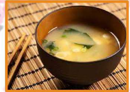
N10. Sopa Miso