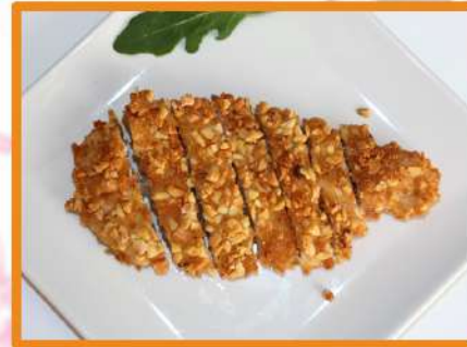
N37. Pollo frito almendrado (crujiente)