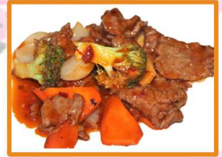
N56. Ternera Gongbao (picante)