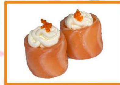
116. Sake gunkan

(salmón, arroz, queso crema y un toque de tobiko)