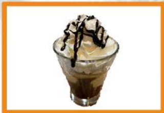
Frapuccino con sirope (café, helado, nata) 5.75 €