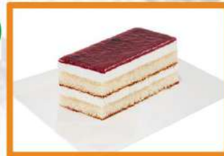
Tarta lingote (hay 4)

- queso y arándanos - selva trufa- San Marcos