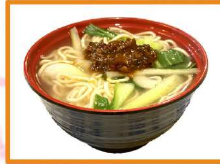
N28. Ramen ternera

(sopa de tallarines ramen con salsa especial de ternera y un toque picante)