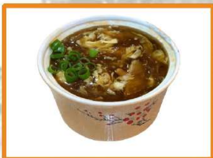
N11. Sopa shitake

(pollo, setas shitake, fideos, huevo, bambú)