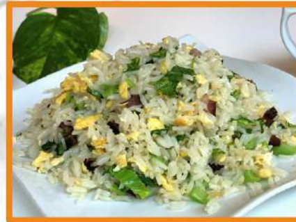
N24. Arroz de la casa