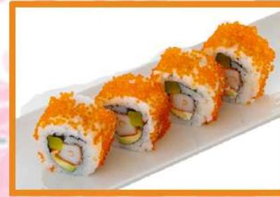
N102. California tobiko (surimi, pepino, aguacate, nabo japonés y huevas pez volador) - 4 PZ