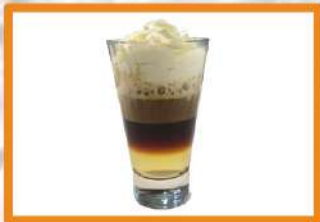
Café Irlandés (café, whisky, nata) 5.95 €