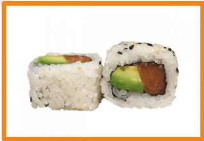
N100. California salmón y aguacate 4 PZ