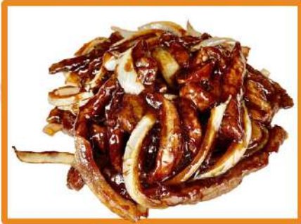
N51. Ternera con cebolla