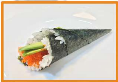
N91. Temaki salmón (con aguacate y tobiko)