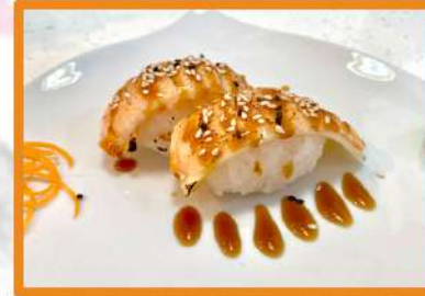
N86. Nigiri salmón flambeado - 2pz