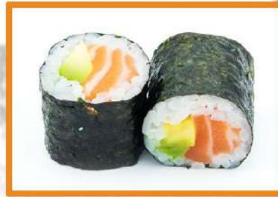
N65. Maki salmón y aguacate - 4pz