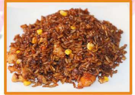
N29. Arroz Yorokobi

(sopa de tallarines ramen con salsa especial de ternera y un toque picante)