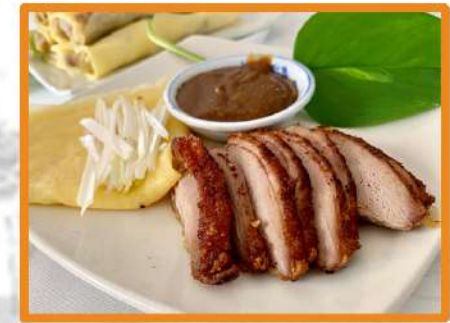
N50. Pato asado Pekin (con creps) - 2 pz + 2€ (1ºGratis)