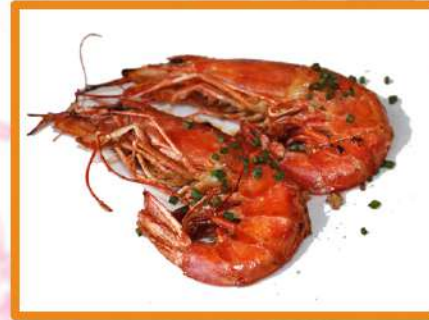
N45. Gambón a la plancha - 2pz