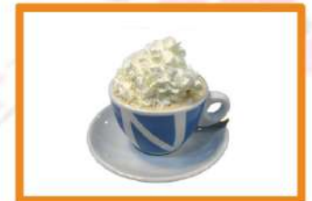
Café Vienes 2.50 €