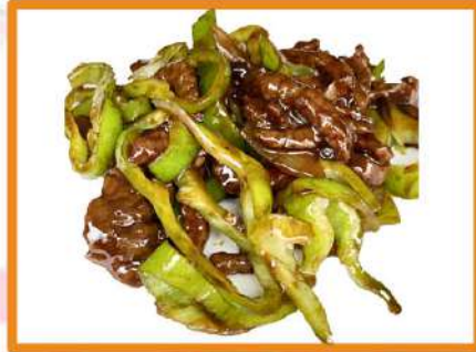
N52. Ternera con pimientos