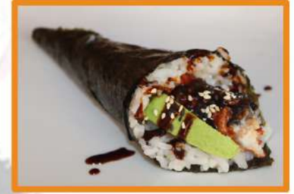
N94. Temaki anguila cabayaki (con aguacate y sésamo) +1€ (1º Gratis)