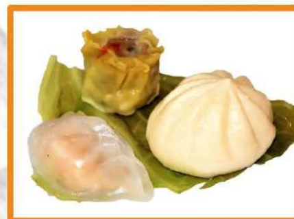
N13. Dim sun variado