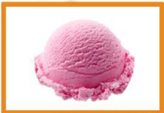
1 Bola de helado (5 sabores a elegir) 2.75 € + 1 €/cada bola extra