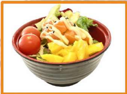
N4. Ensalada japonesa

(lechuga, tomate cherry, salmon, mango, aguacate, sésamo)