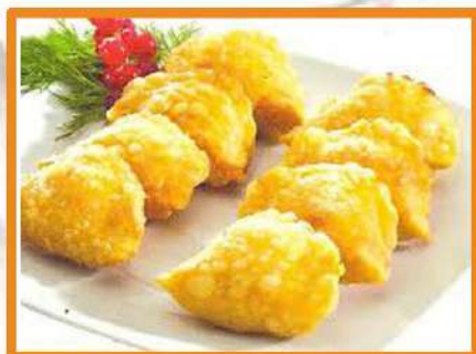
N12. Guotie frito

(pollo, setas shitake, fideos, huevo, bambú)