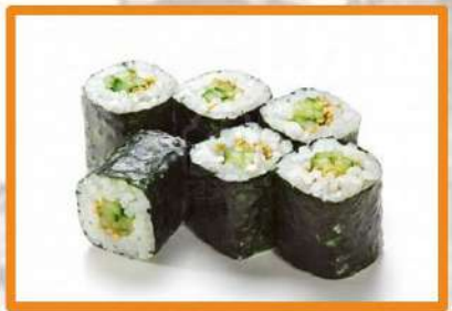
64. Maki pepino (mayonesa) - 4 pz