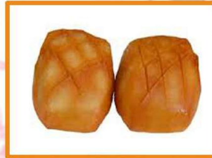
N9. Pan frito japonés