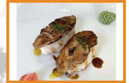
N114. Nigiri Foie 2pz +2€