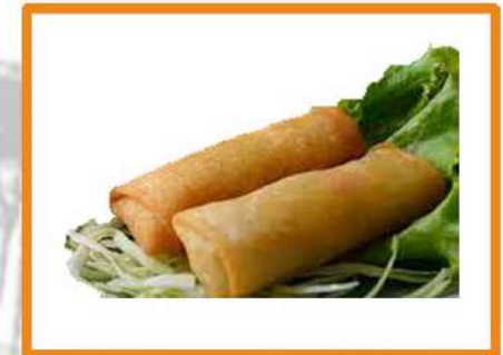
D1. Rollitos vegetales