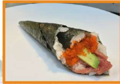
N92. Temaki atún rojo (con aguacate y tobiko) +1€ (1º Gratis)