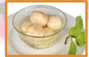
Lichis en almíbar 2.95 €