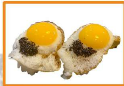
N84. Nigiri huevo codorniz trufa - 2pz