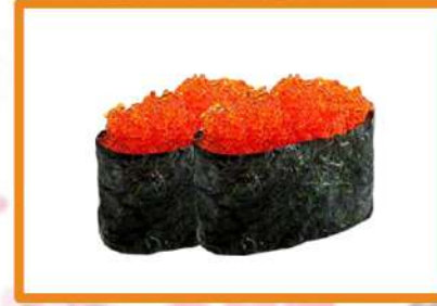
N89. Gunkan tobiko 2PZ +1€ (1º Gratis)