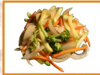
N33. Verduras variadas salteadas