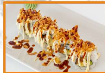
N105. Crazy roll (salmón, aguacate, mayonesa, cebolla frita y salsa teriyaki) - 4 PZ