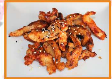
N38. Pollo crujiente Shino (con un toque picante)