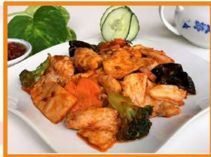
N36. Pollo Jiangbao (cebolla, zanahoria, brocoli, bambú, algas)