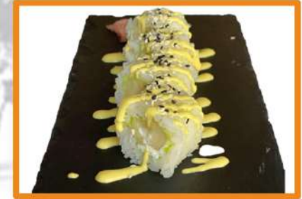
N99. Banana roll (con philadelphia y sésamo) 4PZ (Gold)