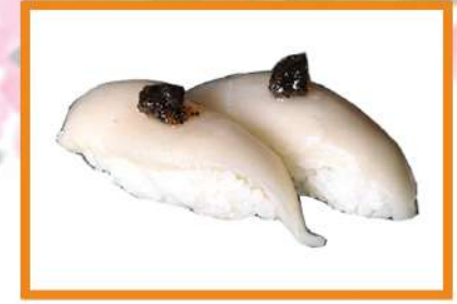
N82. Nigiri pez mantequilla trufa 2pz