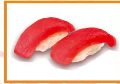
N81. Nigiri atún rojo - 2pz +1€ (1º Gratis)