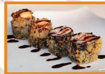
N110. Maki salmón tempurizado - 4 pz