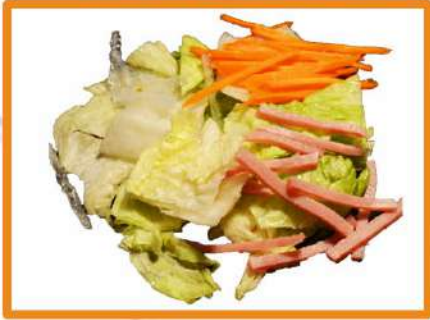
N1. Ensalada china

(lechuga, zanahoria, jamón York algas y brotes soja)