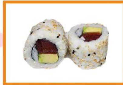
N101. California atún y aguacate 4 PZ +1€ (1º Gratis)