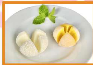
Mochis sabores - 2pz 4.95 €