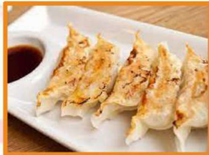
N8. Gyozas de pollo