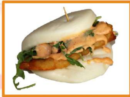
N15. Langostino bao

(pollo frito japonés, rúcula y salsa teriyaki)