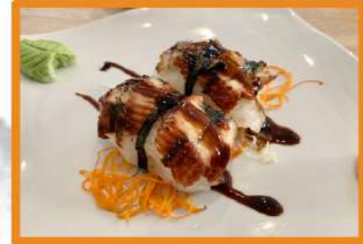
N85. Nigiri anguila flambeado - 2pz +1€ (1º Gratis)