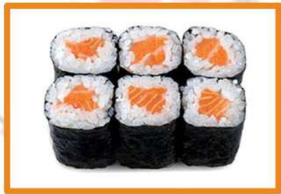
N60. Maki salmón - 4pz