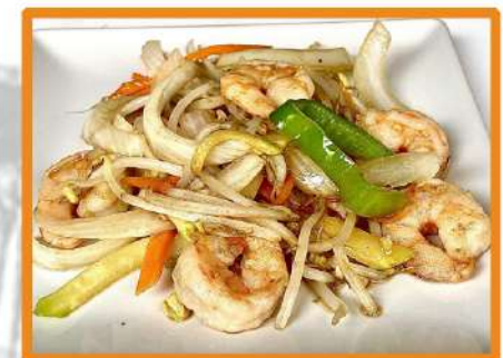
N42. Gambas con verduras