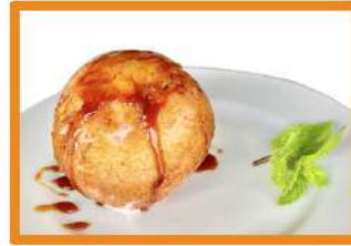
Helado frito con miel 4.30 € (flambeado + 1€)