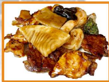
N47. Familia feliz (pollo, ternera, gambas y verduras)