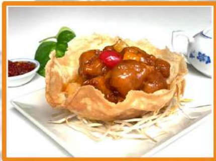
N31. Cerdo agridulce