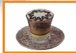
Machiato bombón (leche condensada, café, crema, cacao, sirope) 3.20€