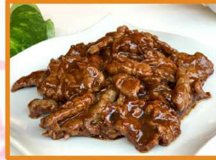
N54. Ternera con salsa de ostras