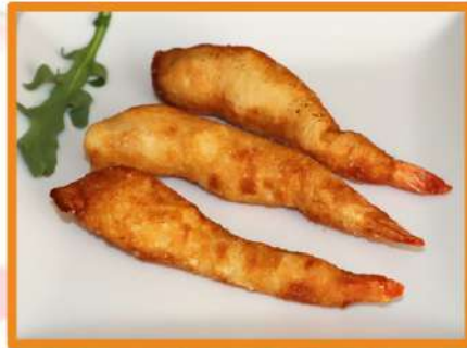
N44. Langostinos rebozados - 3pz