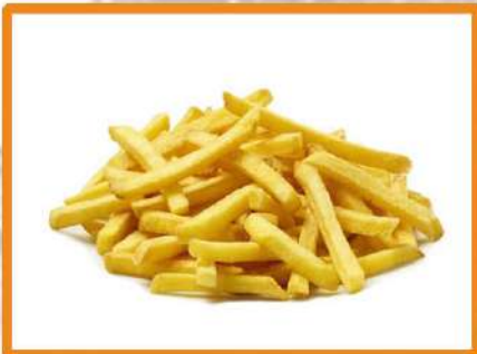
N20. Patatas fritas