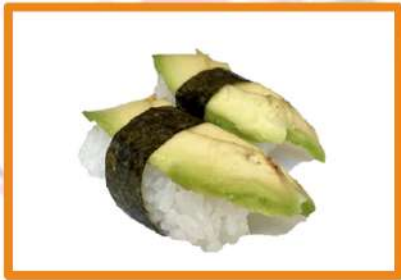
N79. Nigiri aguacate 2pz (Gold)