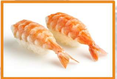
N83. Nigiri ebi (cocido) - 2pz