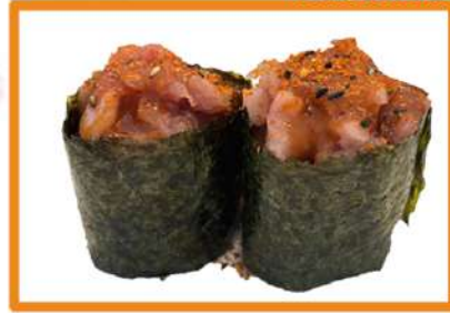
N88. Gunkan atún picante - 2PZ