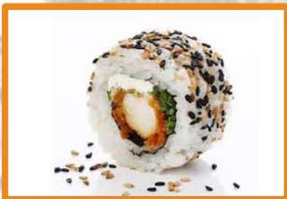
N104. California Tori (pollo frito japonés)