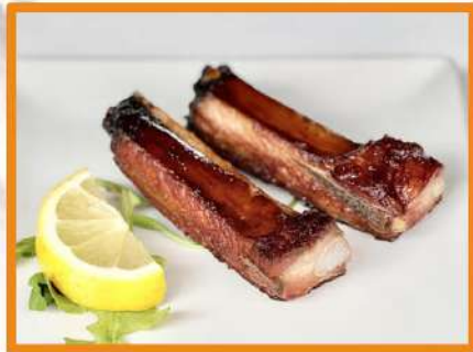
N32. Costillas cerdo asadas