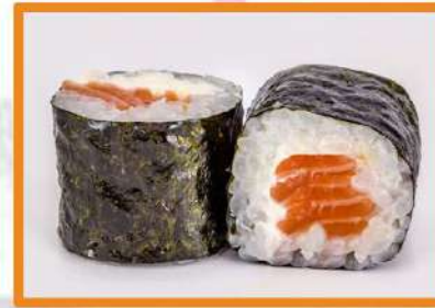
N66. Maki salmón philadelphia - 4pz