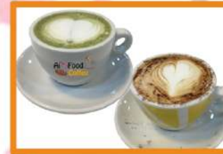
Capuccino cacao o Matcha (té verde o café con leche cremosa) 2.75 €