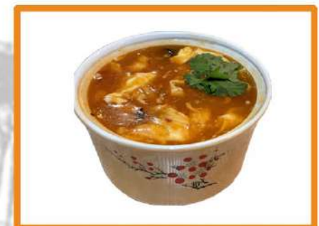
N16. Sopa agripicante

(pollo, fideos, bambú, huevo, algas, tofu)