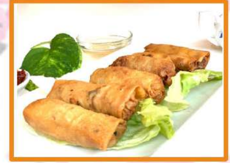
N3a. Rollitos Vietnam