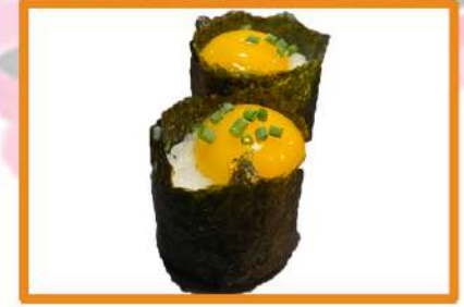
N90. Gunkan huevo codorniz (crudo)