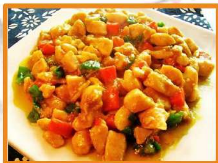
N40. Pollo Thai (con verduras,salsa de curry y coco)