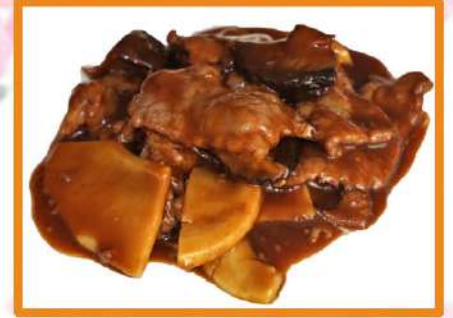
N55. Ternera bambú y setas Shitake