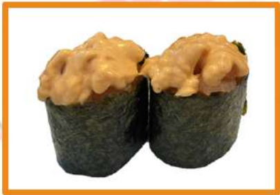
N87. Gunkan salmón 2PZ