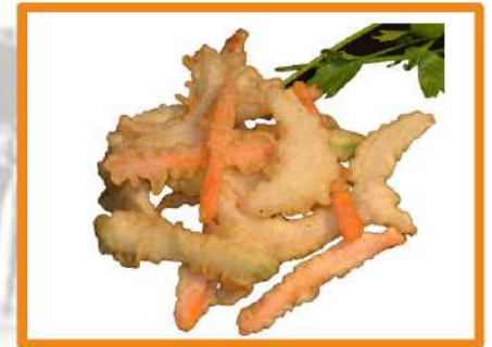
N34. Tempura de verduras