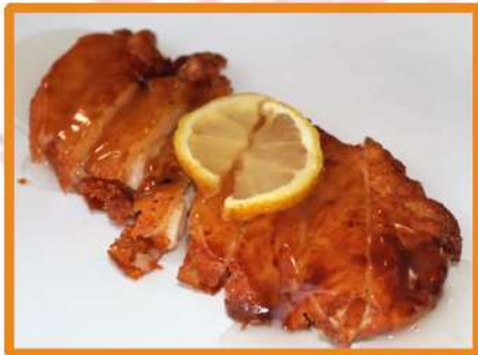
N35. Pollo frito al limón