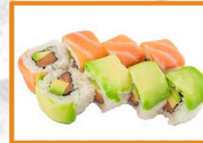
N107. Uramaki Pasión (salmón aguacate) - 4 PZ